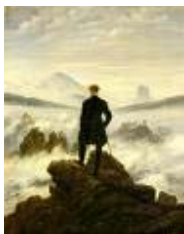
The Wanderer Above a Sea of Mist