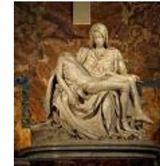
Pietà de Michelangelo.