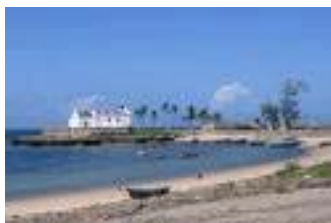
Ilha de Moçambique